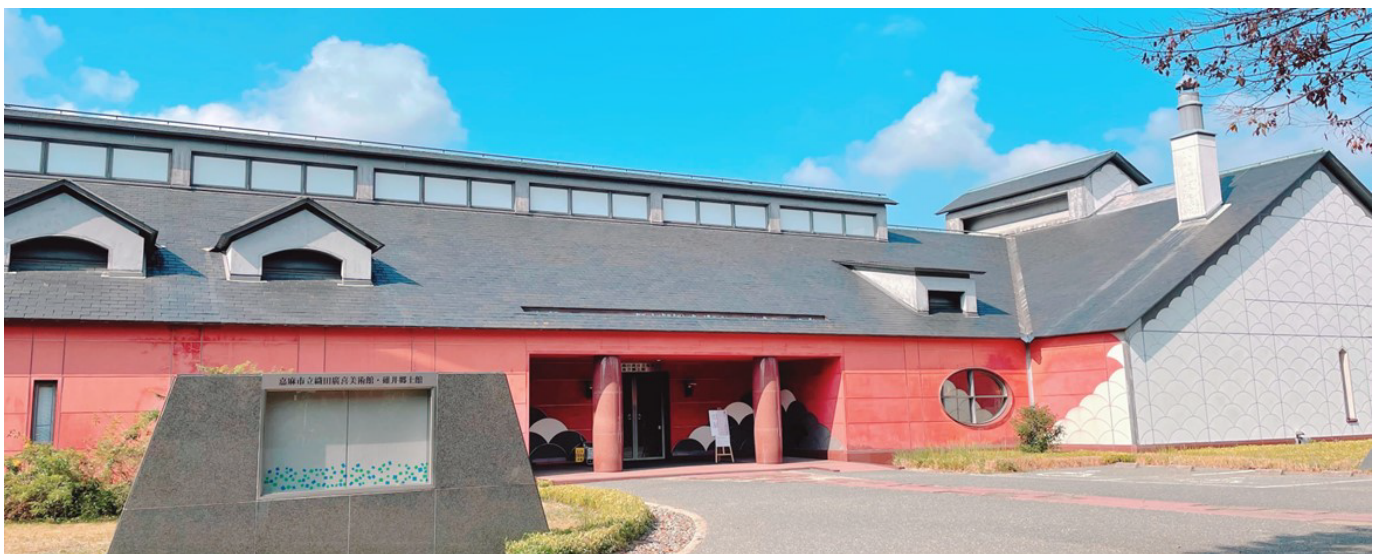
織田廣喜美術館外觀

| 實習簡介 | 織田廣喜美術館是位於日本的福岡縣中部的嘉麻市。該館位於農村地區的碓井琴平文化館內。該美術館的佔地面積約2.388平方公尺並開館於1996年5月。該美術館以日本代表性藝術家之一的織田廣喜 (Hiroki Oda) 大師的名字命名並以展示其歷年來的作品聞名。近期令人興奮的展覽是邀請國際知名兒童繪本藝術家清野幸子展出其《小貓丹丹》繪本的原畫和素描以慶祝該繪本的45週年出版。詳細介紹請參閱該館官網或FB ( https://odabi.libweb.jp/ / FB https://www.facebook.com/odahiroki1996/ )